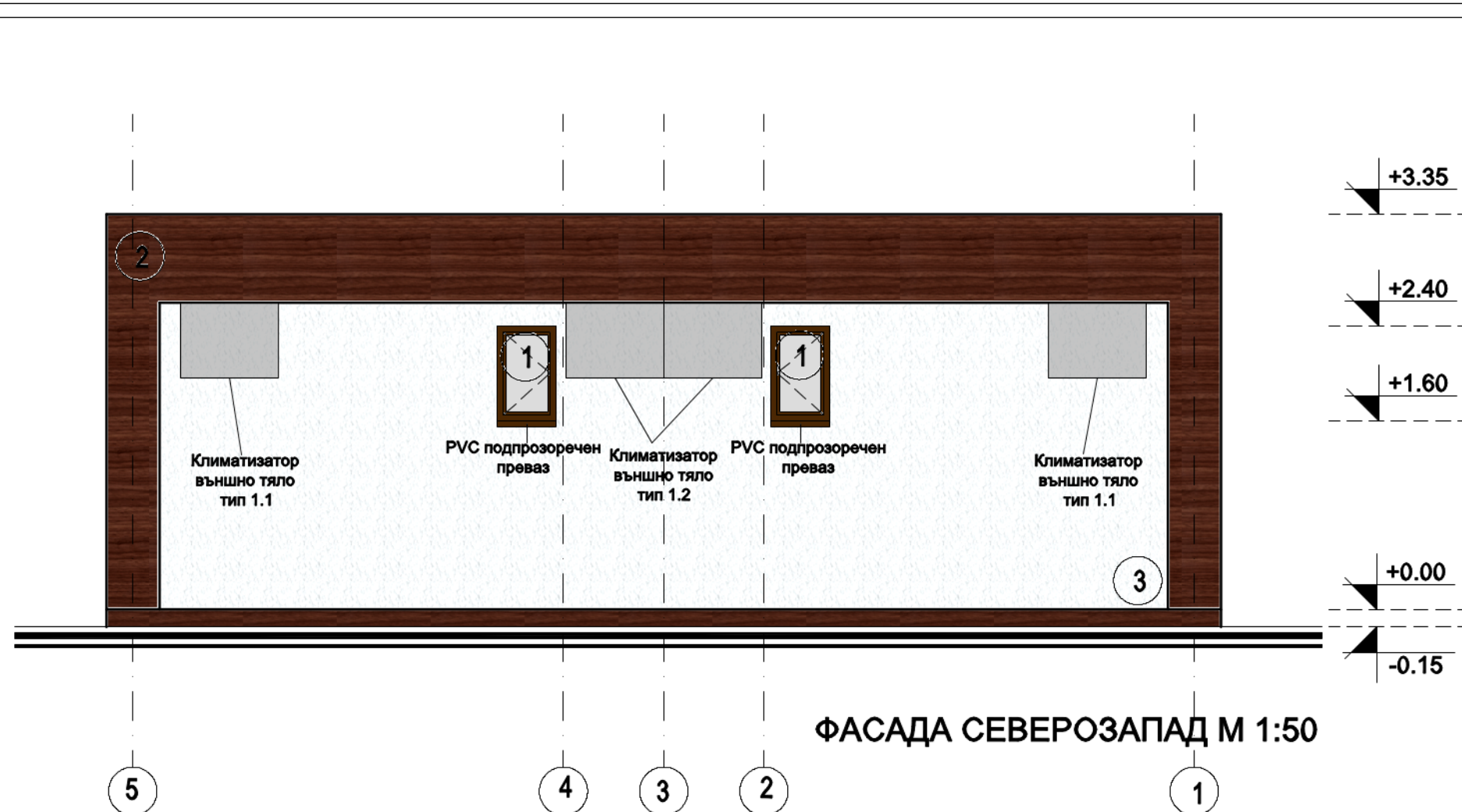
ФАСАДА СЕВЕРОЗАПАД М 1:50