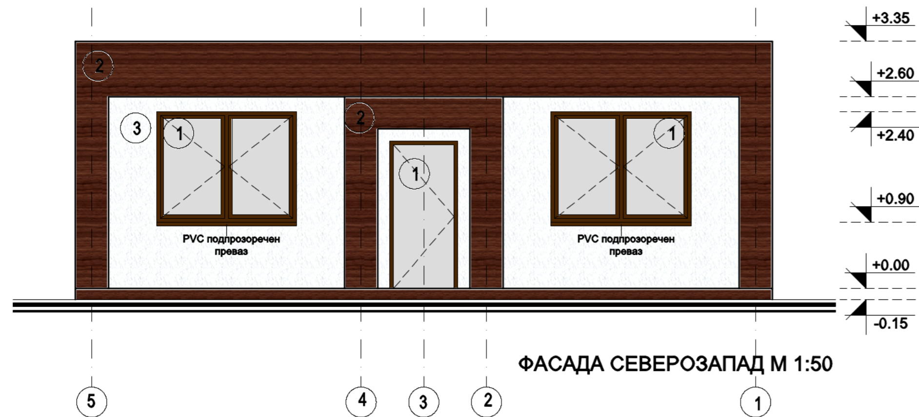
ФАСАДА СЕВЕРОЗАПАД М 1:50